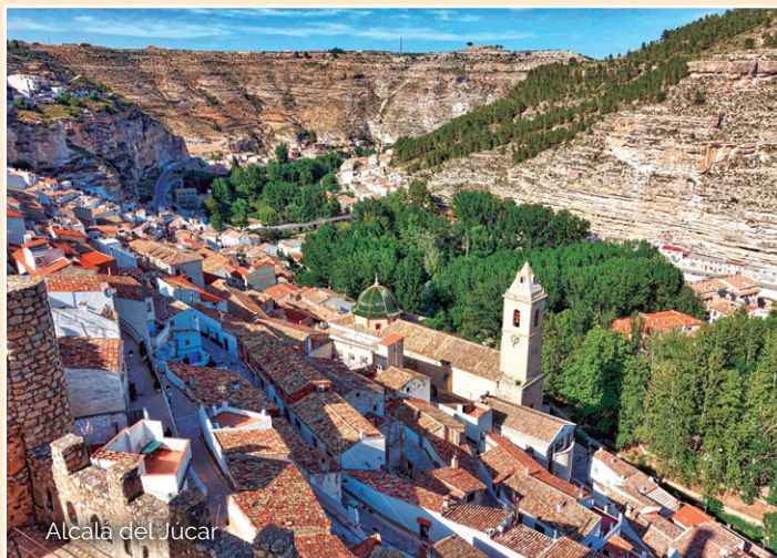
Alcalá del Júcar

Día 28 de Marzo: ALBACETE-VALENCIA-PALMA. Desayuno en el hotel. Tiempo libre. A la hora acordada traslado al aeropuerto para la salida del vuelo a las 15:35hrs destino Palma. Llegada a Palma a las 16:30hrs. FIN DEL VIAJE.